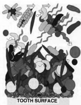
図1 バイオフィルムの構造 (文献2より引用、転載) 歯面のペリクル上にActinomyces属、Streptococcus属が付着、さらにFusobacterium、 P. gingivalis に代表される歯周病原菌が共凝集する。

Fig. 1 Structure of biofilm (from Reference 2) Actinomyces and Streptococcus bacteria were adhered to the tooth surface pellicle, and co-agglutinated with Fusobacterium and P. gingivalis , which are periodontal pathogens.