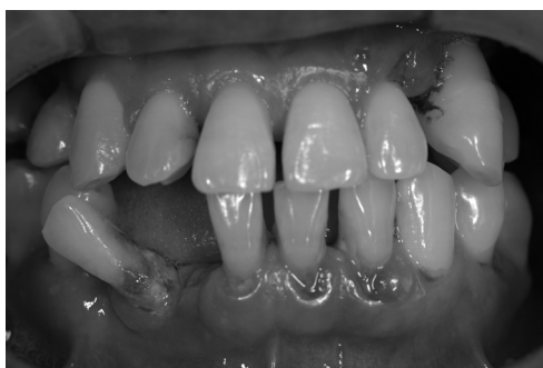
図4 易感染性・リスクを有する患者口腔内 易感染性・リスク症例を有する中等度以上の歯周疾患では、抗菌療法のSRPとの併用は有効である。

歯周基本治療は、口腔内からの可及的な原因除去を目指した治療法であり、すべての歯周治療に共通して実施される。一方、歯周組織検査、ブラッシング、さらにケーリング・ルートプレーニング (SRP) など歯周治療の過程においては、一過性の菌血症が発症する頻度が高いといわれている 20) 。そのため、細菌性心内膜炎、大動脈弁膜症、チアノーゼ性先天性心疾患、