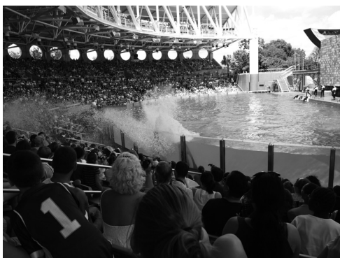
図2 理事会会場からも比較的近いところにSea Worldがある