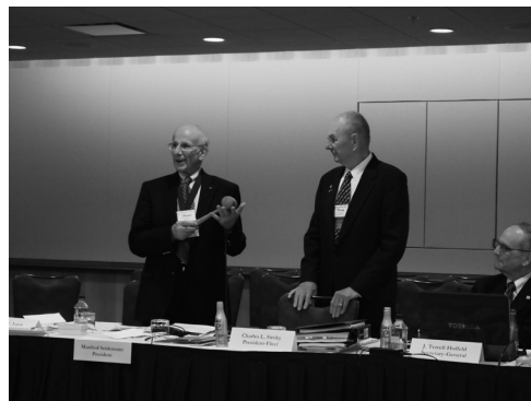
図7 前会長から新会長へのGabelの手渡しの儀式