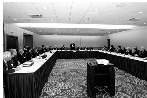
図4 理事会会場。理事の席順は、アルファベット。テーブルには各部会からの配付物がところ狭く並ぶ