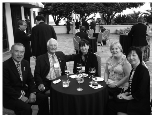
図8 理事会初日終了後のアメリカ部会長の招待レセプションで。ご夫人方を交えてのお付き合いも大切で、様々な話題が飛び交う

になり（これまでは1日半）、これまでと比べるとかなり「突っ込んだ」議論が行われたように感じた。役員8名、国際理事28名の参加のもと、6日早朝から、恒例により、点呼の後、前年（横浜）の理事会の議事録承認が行われ、各役員、委員会の報告がこれに続いた（図4）。重要な案件としては、1）新Section（中国、ミャンマー）設立とRegion編成に伴う定款や規程の変更、2）Caption Feeの値上げ（その後実施が延期され2012年1月からとなった）、3）会員管理データベースの構築（2011年度から）、4）今後の国際理事会開催のあり方（次年度の6ヶ月以内に開催することが決められた）、5）2011年度（インド・ニューデリー）・2012年度（サンフランシスコ）・2013年度（中国）の国際理事会開催地…についてなどであり、その他今後の役員選出のあり方をより民主的かつ透明性を上げたものとする（Nomination Committeeの委員に前会長らのほか5番目の委員として理事から1