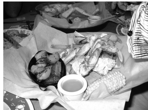
図3 さすが有名観光地！料理は安くてうまい！カニ食べ放題で一人2千円は安い