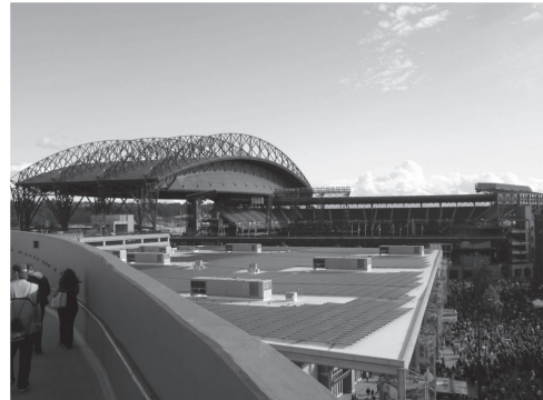
図6 天然芝と開閉式の屋根をもつセーフコフィールド（シアトル・マリナーズ） fig. 6 Safeco Field (Seattle Mariners) is the ball park with real grass and a retractable roof.