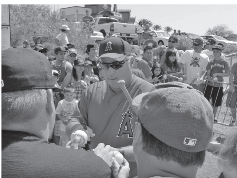
図3 ボールにサインするエンジェルス・ソーシア監督(アリゾナ)