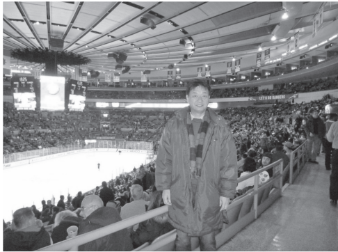
図14 マジソンスクエアガーデンでNHLの試合を観戦する筆者（ニューヨーク） fig. 14 The author watches the game of NHL in Madison Square Garden (New York)

がります。日本では、アメリカンフットボールはそれほど普及していないので、ルールを理解されていない方が多いと思いますが、前もってNFLの中継を少し見ておけばルールもわかり、より楽しく試合を観戦することができると思います。