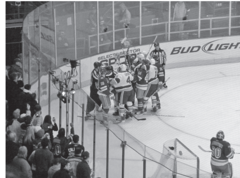
図15 NHLのゲームではしばしば乱闘がみられる（ニューヨーク） fig. 15 In the game of NHL, a brawl is often seen (New York)

どちらも屋内で試合が行われ、同じスタジアムでバスケットとアイスホッケーの両方を開催する場合があります。例えば、ニューヨークのマジソンスクエアガーデンは、バスケットではニューヨーク・ニックス、アイスホッケーではニューヨーク・レンジャースのホームになっています。おおよそ18,000から20,000人収容のスタジアムがほとんどですが、NHLのリンクの方が大きいので、アイスホッケーの試合ではバスケット