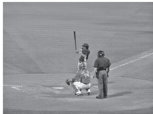
図2 イチロー選手の打席(スプリングキャンプ、アリゾナ)