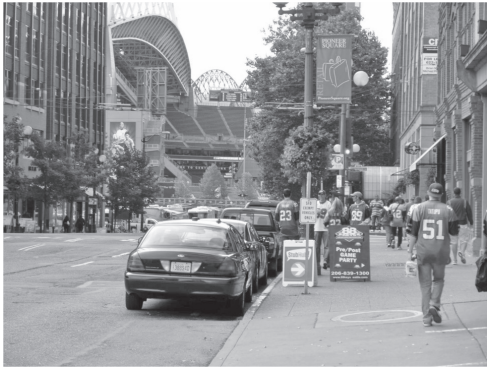
図10 試合の日はチームウェアを着た多くの人々が登場する（スタジアム周囲、シアトル）

fig. 10 Many people with team wear appear the game day (Near the stadium, Seattle)