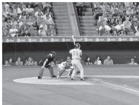
図9 ニューヨーク・ヤンキース時代の松井秀喜選手（アナハイム） fig. 9 Hideki Matsui of the New York Yankees era (Anaheim)

NFLには、AFC (American Football Conference) とNFC (National Football Conference) の2つのカンファレンスがあり、それぞれ16チーム、計32チームが所属しています。フォーブス誌の2011年の統計で、