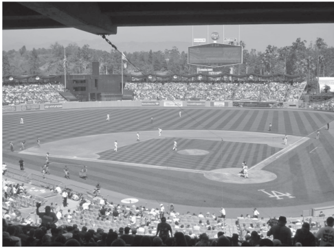
図5 ロサンゼルス・ドジャースのホームであるドジャースタジアム fig. 5 Dodger Stadium is the home ballpark of Los Angeles Dodgers