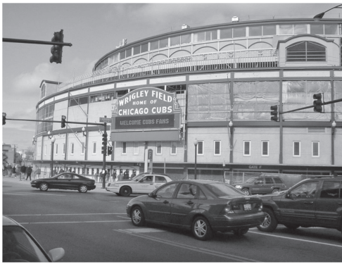
図7 MLBで2番目に古いリグレイフィールド（シカゴ・カブス）は1914年に建てられた fig. 7 Wrigley Field (Chicago Cubs) was built in 1914 and the second-oldest ballpark in the MLB

は4万人以上収容できるので、チケットは比較的取りやすいと思います。ただし、ニューヨーク・ヤンキースやボストン・レッドソックスなどの人気チームのホームゲームは、売り切れになることが多くなります。このような場合は、公認のチケットブローカーから合法的に転売チケットを購入することができます。最大手のStubHubでは、MLBだけでなく、フットボールやバスケットなどほとんどのゲームチケットが購入可能です。アメリカにコンタクトアドレスが必要ですが（滞在するホテルでも登録可能）、日本でもインターネット配送のチケット（エレクトリックデリバリー）であれば簡単に手配できます。ただし、人気のあるチケットほど購入価格は高くなり、額面の何倍にもなる場合があります。逆に、優勝決定後の消化試合など人