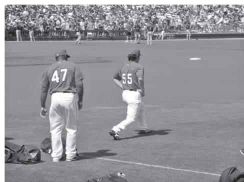
図4 試合前の松井秀喜外野手(アリゾナ)