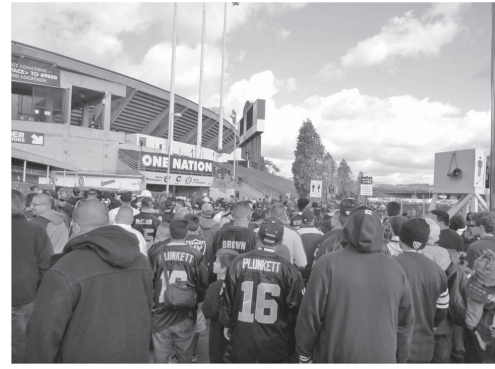
図11 多くの観客であふれかえるNFLのスタジアム（オークランド・レイダース）

fig. 12 Fireworks are launched in the entrance of home players (Seattle Seahawks)