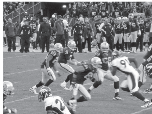
図13 スタジアムでは迫力満点のNFLの試合が楽しめる（オークランド）

選手入場、国家斉唱に続いて試合が開始されます。地元チームの選手が入場する時は花火などで盛り上げるスタジアムも多いようです。試合では、司令塔となるクォーターバック（QB）を始めとして、100メートルを10秒台で走れる選手や、相撲の力士なみの体格を持った選手など、ポジションに応じた体格、能力をもった選手が登場します（図12、13）。QBのヘルメットには無線がついており監督（ヘッドコーチ）の指示を受けて攻撃スタイルを決めていきます。アメリカの観客はフットボールのルールを良く理解しているので、地元チームのチャンスには大きな声援がひびきわたります。逆にビジターチームの攻撃では、QBの指示が伝わりにくいようにクラウドノイズと呼ばれる大きな騒音を発します。どちらの場合も観客席は大いに盛り上