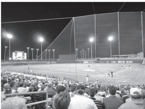
図1 スプリングキャンプで使用される典型的な球場(アリゾナ)

一方、レギュラーシーズンの試合は、平日の夜(ナイトゲーム)そして土日の昼間(デイゲーム)に開催されます。年間162試合あることに加え、球場の多く