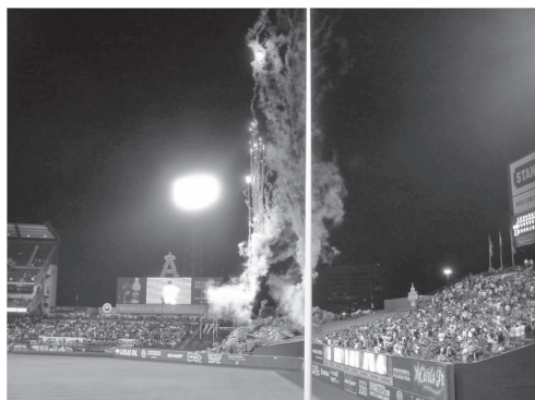
図8 ホームであるエンジェルス選手がホームランを打つと花火が打ち上げられる fig. 8 Fireworks will be set off if the player of Angels hits a home run (Anaheim)

のチャンスや得点の際は大いに盛り上がります。緑のきれいな球場で、ホットドッグやビールを片手に野球観戦を楽しんでいただければいいと思います。