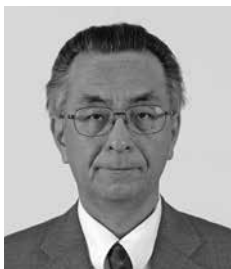
※冬期学会コーディネーター