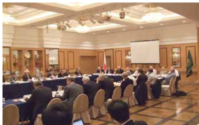
図2 2009年5月 国際理事会（パシフィコ横浜）